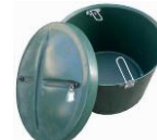
šachta na dmychadlo