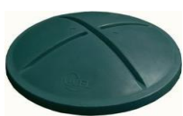
standardní víko se zámký

Doporučené prodejní ceny bez DPH, platné od 1.4.2018 do 31.3.2019