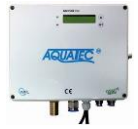
řídicí jednotka AQC Plus