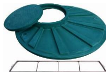
příplatkové pochozí víko