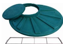
příplatkové pochozí víko