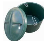
šachta na dmychadlo